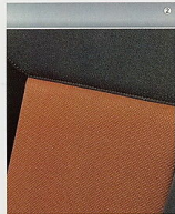
Stoff Tabito, Rot/Anthrazit