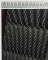
Stoff Alpha, Silber/Anthrazit