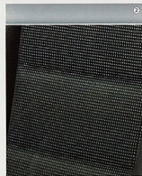
Stoff Alpha, Silber/Marracano, Anthrazit