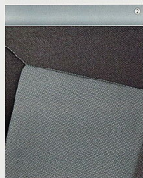
Stoff Tabito, Stahlgrau/Anthrazit