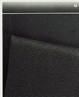
Stoff Alpha, Anthrazit