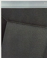
Stoff Tabito, Anthrazit