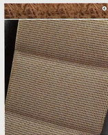
Stoff Alpha, Kaschmirbeige/Marracano, Anthrazit