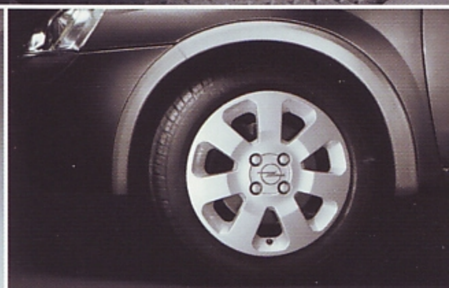
15"-Leichtmetallräder im 7-Speichen-Design mit Reifen 185/55 R15.

Opel. Frisches Denken für bessere Autos.