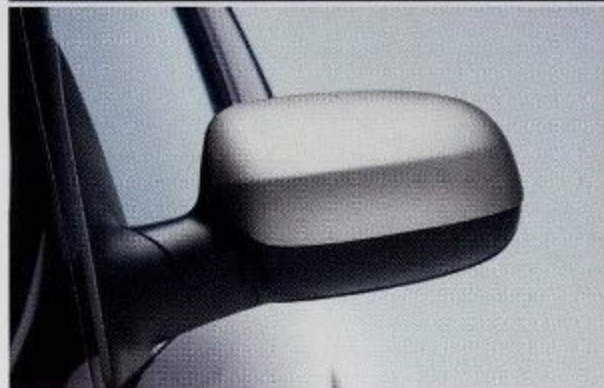
Außenspiegelgehäuse in Starsilber.