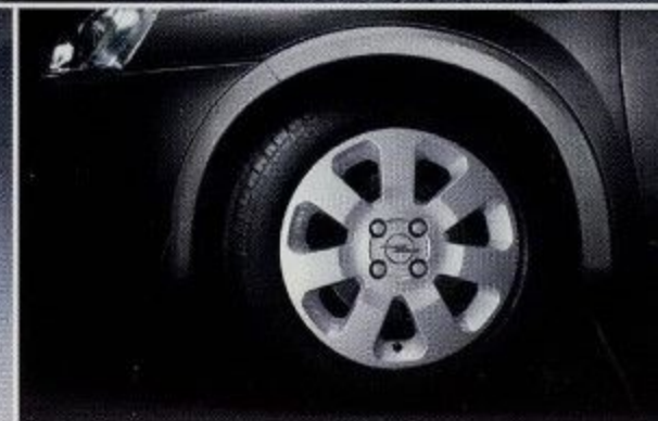
15"-Leichtmetallräder im 7-Speichen-Design mit Reifen 185/55 R15.