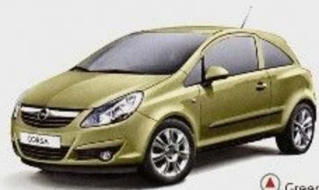
▲ Green Tea