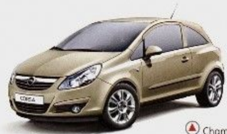
▲ Champagner Silber