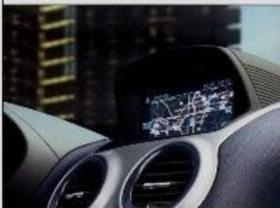
Abbildung zeigt Sonderausstattung.