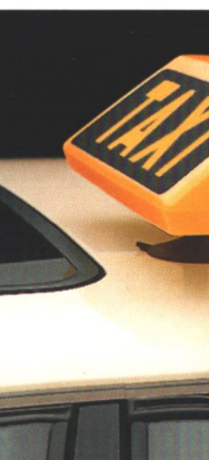
Abb. links u. oben: Splitthoff-Dachschild mit Adapter.