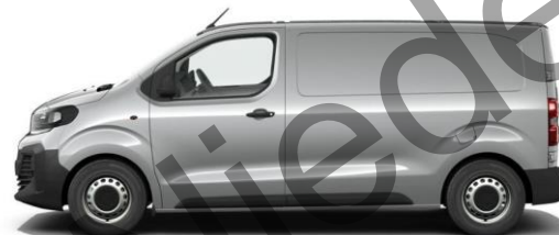
KONTRAST-GRAU M0F4 600,00 (714,00)