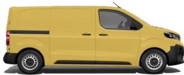
Ginster-Gelb, RAL 1032 EOAS 800,00 (952,00)