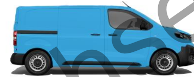
Post Nord-Blau EOCT 800,00 (952,00)