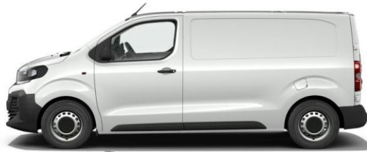
KAOLIN-WEISS POPR 0,00 (0,00)