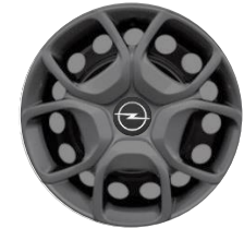
17-ZOLL-RADZIERBLENDE ZHYY Serie i.V.m. PDxx