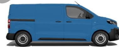
KML-Blau EO3L 800,00 (952,00)