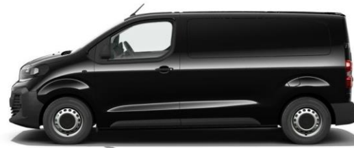
KARBON-SCHWARZ M09V 600,00 (714,00) nicht i.V.m. SPORTIVE