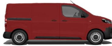
Ardent-Rot EOX9 800,00 (952,00)