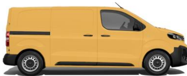
Gold-Gelb, RAL 1004 EOBS 800,00 (952,00)