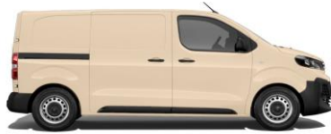
Hellelfenbein, RAL 1015 EOCC 800,00 (952,00)