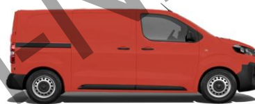
Feuer-Rot, RAL 3000 EOJH 800,00 (952,00)