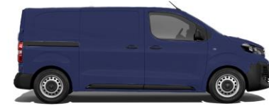
Imperial-Blau EO4P 800,00 (952,00)