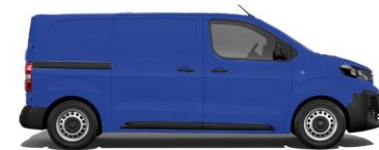
EDF-Blau 1987 EOMG 800,00 (952,00)