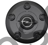
RADNABENABDECKUNG ZHYV, ZHYW, ZHZQ Serie