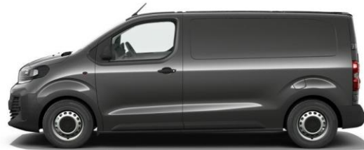
MERKUR-GRAU M01J 600,00 (714,00)