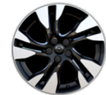
17-ZOLL-LEICHTMETALLFELGE ZHZN Serie i.V.m. SPORTIVE