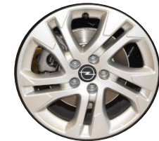
17-ZOLL-LEICHTMETALLFELGE ZHZL 650,00 (773,50)