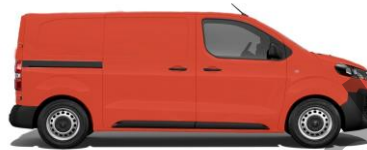
Post-Rot GB EO1W 800,00 (952,00)