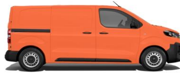
Kommunalorange, RAL 2011 EOHS 800,00 (952,00)