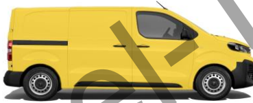
Verkehrsgelb, RAL 1023 EOA4 800,00 (952,00)