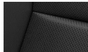
LEDER CLAUDIA CYFX Paket Luxury